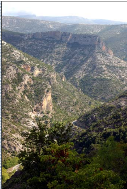
Kaňon řeky Bardon