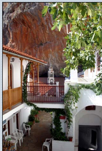
Vnitřní nádvoří kláštera

Hodně starých lidí zde dosud mluví jazykem staré Sparty „chakonikou“