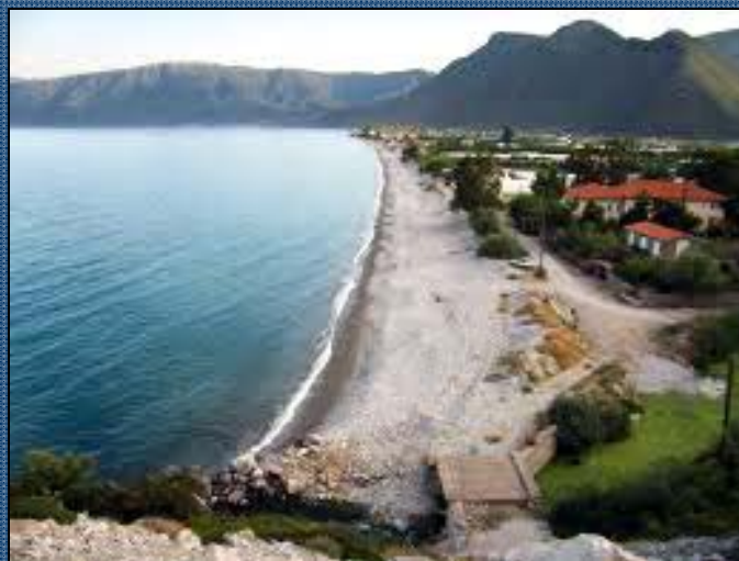
Pláž v Leonidii

Pro návštěvníky kláštera doporučuji vhodné oblečení, triko (košile) s krátkým rukávem zakrývající ramena, šortky. U žen by měla být zakryta kolena.